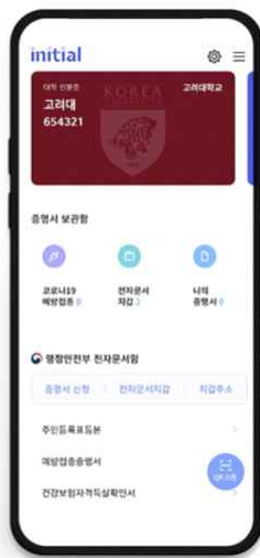
▲ 모바일 학생증 [기본발급]

※ 외국인 학생은 5페이지의 Ⅲ. Non-Financial Student ID (Foreign Students Only) 내용을 참고하시기 바랍니다.